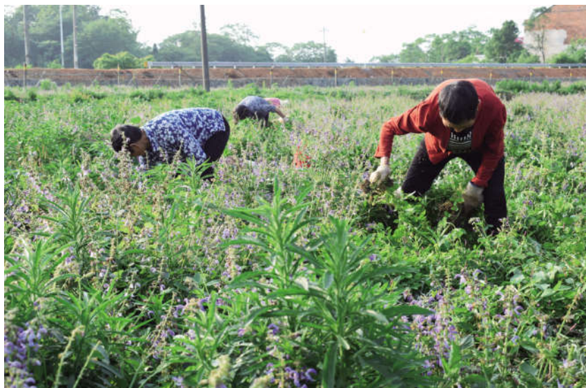
锁石镇林源苗木种养殖专业合作社利民村中药材基地420多亩,委托帮扶贫困户29户103人,解决劳务就业20多人,其中贫困劳动力十来人。

基础设施的改善,引来老板的青睐。全村1000多亩水田,已实施土地流转470余亩,先后建有4个产业基地,其中富硒莲300多亩、龙虾30多亩、葛根80多亩。村里也成立上尧种养农民专业合作社,栽种油