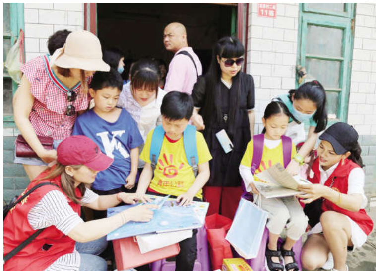
5月24日志愿者为孤儿进行志愿服务

5月24日,青年公社分会10多名志愿者到冷水江市铎山镇龙潭村看望四户7名孤儿,为每一名孤儿送去了一份生活物资和学习用品。这7名孤儿分别