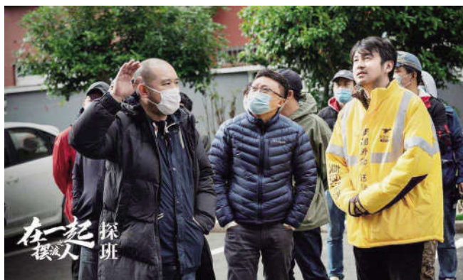
雷佳音扮演快递小哥

由国家广电总局组织指导,上海广播电视台和耀客传媒、尚世影业共同出品的重点抗疫题材时代报告剧《在一起》正在北京、上海、无锡等地拍摄。该剧以“抗疫”期间各行各业真实的人物、故事为基础,还原小人物在大环境下平凡善意的举动。从5月18日到20日,出品方举行了横跨三地的探班活动,邀请全国主流媒体共同见证作品的拍摄过程。共同参与《在一起》不同单元故事创作的导演沈严、滕华涛、刘江、汪俊和演员雷佳音、杨洋、靳东等分享了他们的感受。