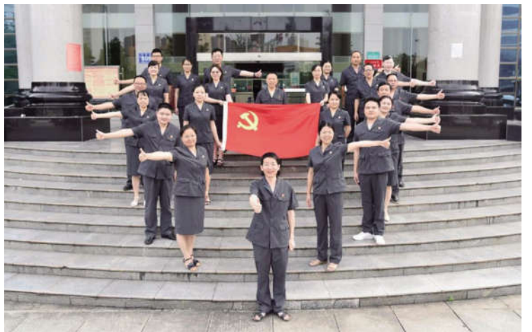
近日,娄底市中级人民法院各党支部开展系列活动,纪念建党99周年。图为“我与党旗合个影,对党旗说出心里话”活动。(龚合)