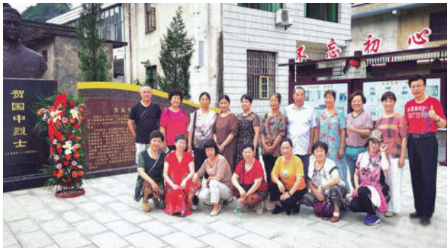
6月29日,娄底市广播电视台组织部分退休人员到省级重点文物保护单位和爱国主义教育基地——红军虎将贺国中故居,缅怀革命先烈的丰功伟绩。(曾热情)