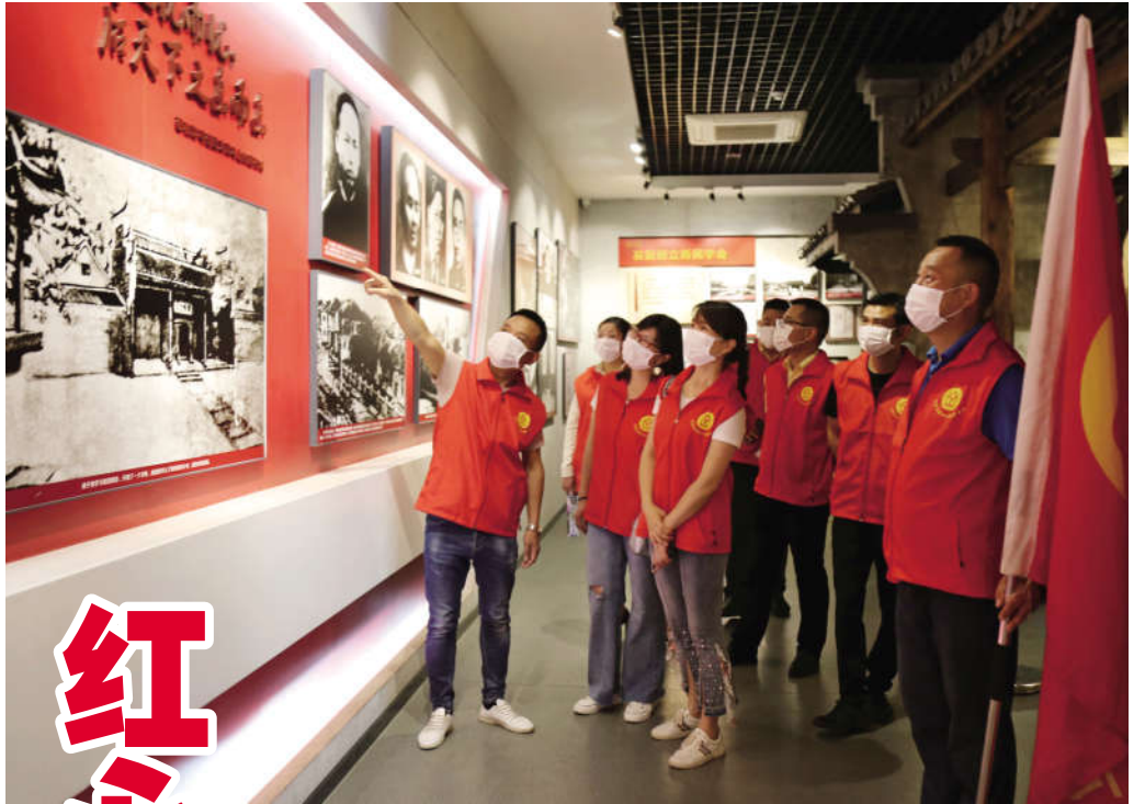
7月1日,正值建党99周年之际,娄底市怡然乐居社会工作服务中心10多名入党积极分子用实际行动践行社会责任,自驾车来到双峰县蔡和森纪念馆参观学习,感受共产党人的初心,接受革命传统教育,传承红色文化精神。(钟志敏)