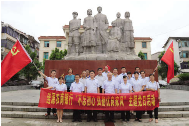
7月1日,涟源农商银行20多名共产党员在蔡和森纪念馆深入开展“不忘初心,弘扬优良家风”主题教育,并在蔡和森同志光辉一家群雕像前敬献花篮、重温入党誓词,用实际行动践行共产党人的初心和使命。(钟志敏 欧阳惠玲)