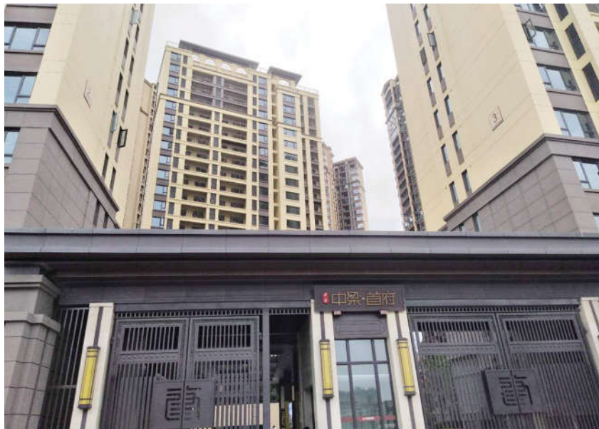
位于娄底经开区梅子湾大桥附近的中梁·首府楼盘