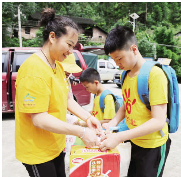
志愿者给孤儿赠送牛奶与八宝粥