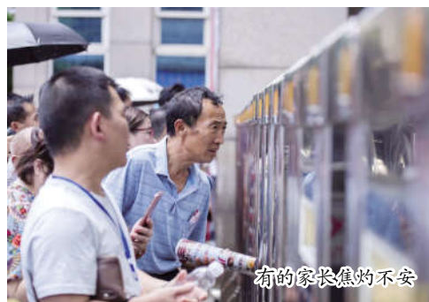
有的家长焦灼不安