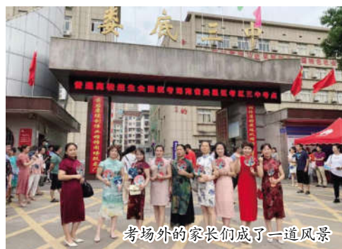
考场外的家长们成了一道风景