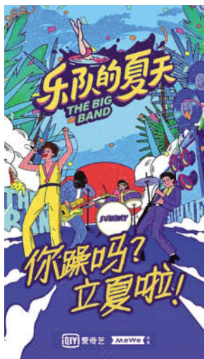
《乐队的夏天》《忘不了餐厅》第二季海报

当行业储备的练习生消耗殆尽后,为了保证节目的选手来源,有的节目甚至会降低对选手的实力要求。“现在行业发展