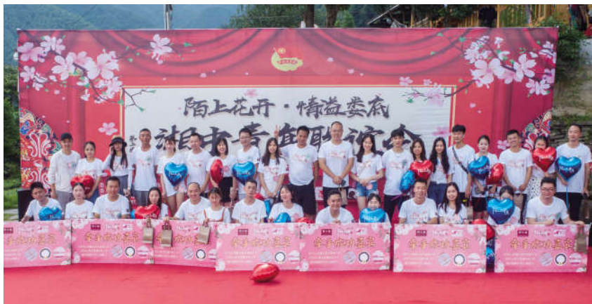
活动现场成功牵手的嘉宾