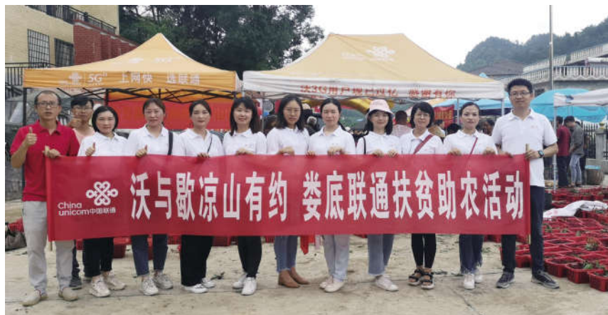
扶贫助农活动现场

今年6月,娄底联通还在歇凉山小学举行了书籍文具捐赠仪式,捐赠的课外书籍、书包和文具不仅解决了学校的实际困难,更温暖了家长和孩子们的心。捐赠仪式后,驻村工作队还特邀了娄底市检察官文学艺术联合会以“同舟共济,检护明天”为主题为全校学生送上一堂法制课,帮助孩子们普及未成年人法治知识,提高自我保护意识。