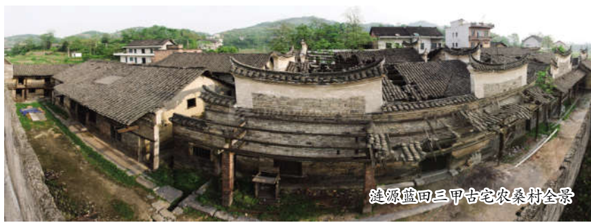
涟源蓝田三甲古宅农桑村全景

世业堂、于时处、敏慎堂、一德庄、树德园、存诚里、青云第、花门楼、怀古住、农桑村、步云山庄、居安草庐，各种屋名显示了先辈们的文化素养和人生哲学。“忠厚乃吾家旧德，诗书为后辈生涯”“黄金非宝书为