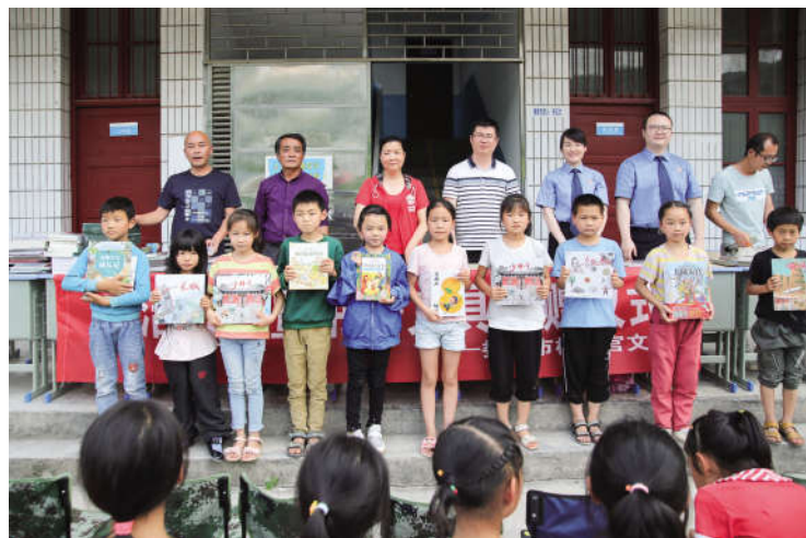
歇凉山小学书籍文具捐赠现场