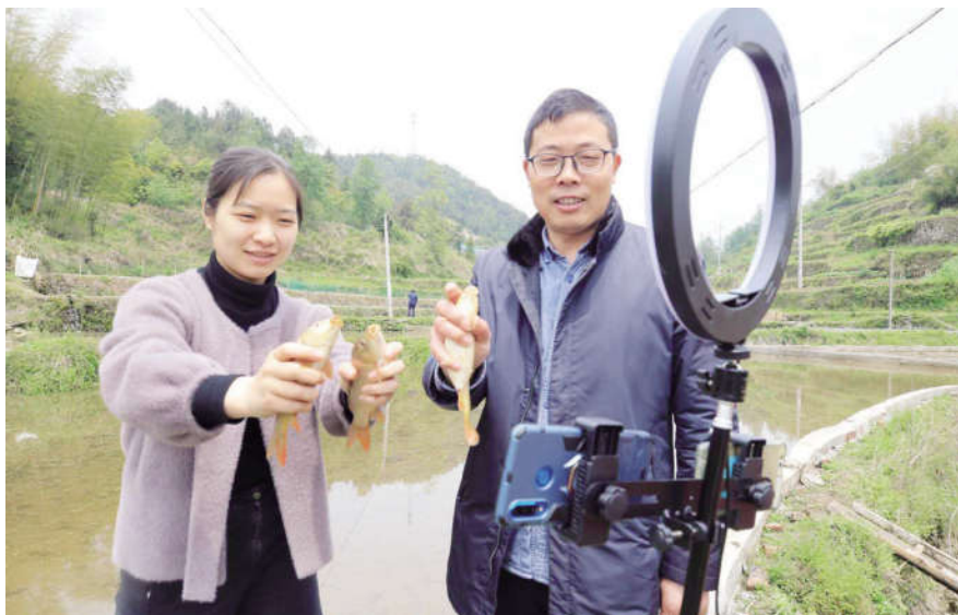
带领村民直播卖货