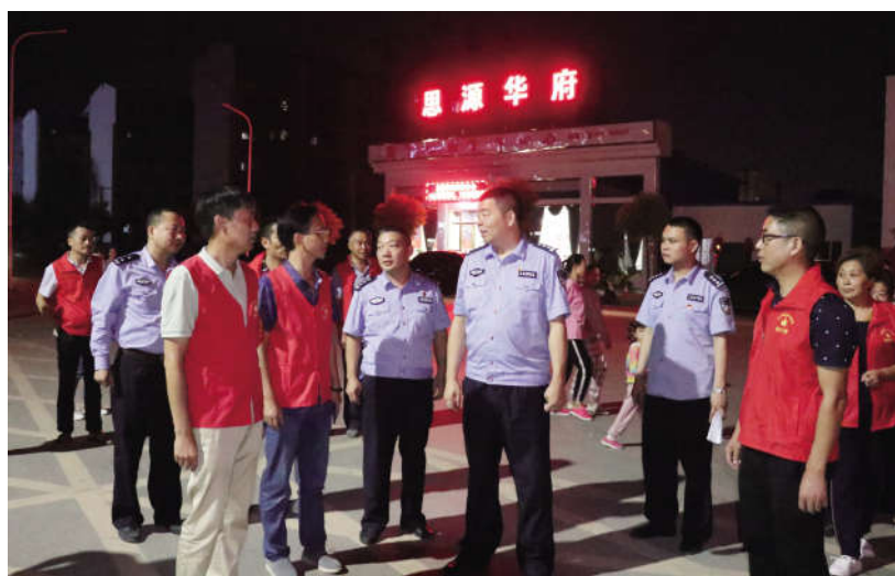
副县长、县公安局局长欧阳灼亮参与社区群防群治

风险防控责任全压实。将责任层层压实到社区两委、网格员、楼栋长,及时掌握风险隐患。洋溪镇集星村委以“带好班子促和谐、上门普法促和谐、关爱弱势促和谐、化解矛盾促和谐、维护治安促和谐”五个方面的措施来防控化解风险,“五促”做法得到副省长、公安厅厅长许显辉充分肯定。奉家镇渠河源村结合自身实际,把“村规民约”和社区警务进行有机融合,打造了景区网格警务;经开区特种陶瓷产业园将保安力量、村干部、社区辅警力量进行有机整合,打造了园区治安小分队,全面压实风险防控责任。