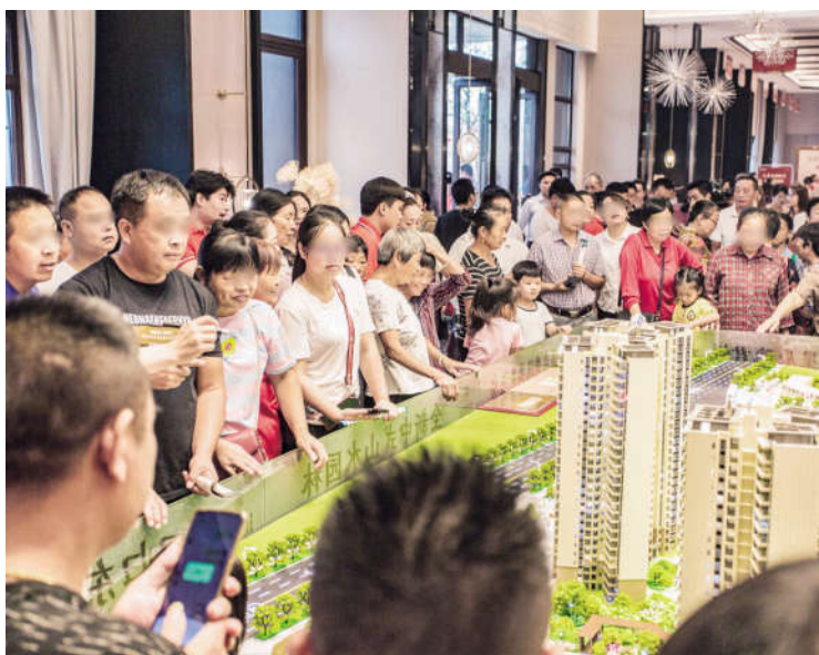
9月5日,碧桂园·瑯悦府经过数月雕琢的实景示范区正式向社会开放。(陈泽宇)