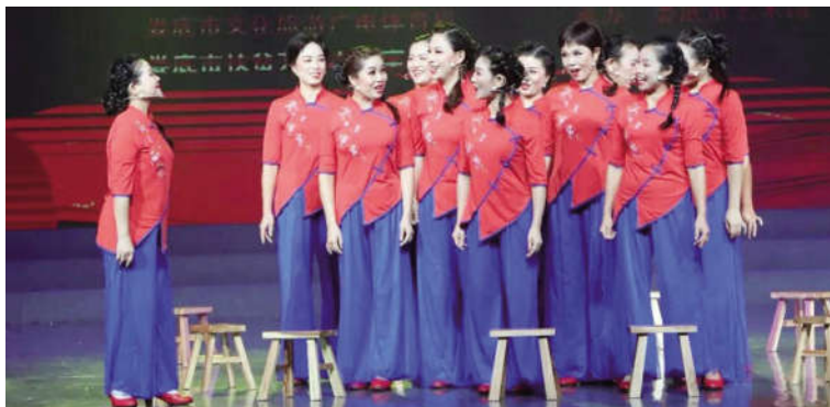
表演唱《日子越过越红火》