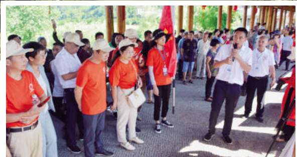
观摩团在麻溪村风雨桥上参观

下午,观摩团来到了位于锡矿山腹地的七里江。在专家的解说和引领下,大家冒着骄阳参观了同心生态文化广场,实地感受了锡矿山区域治“渣”、治“荒”、治“水”、治“田”的成果。通过多年的环境综合治理,这里让百年废渣变净土,让疮痍荒山变青山,让污