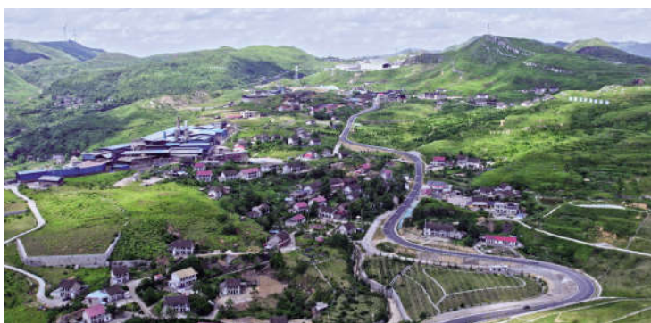
复绿后的锡矿山矿区