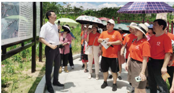
参观同心生态文化广场