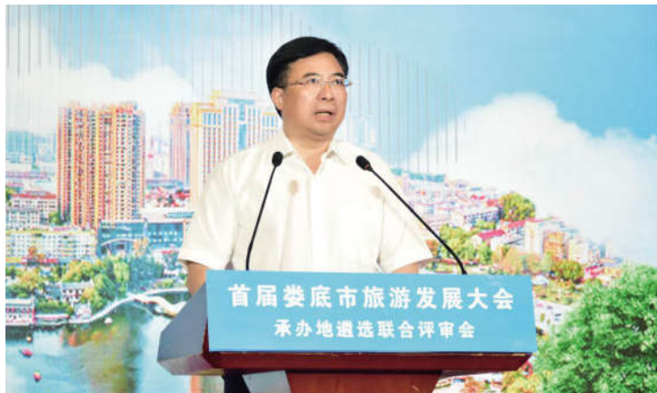
市委书记邹文辉出席并发表重要讲话