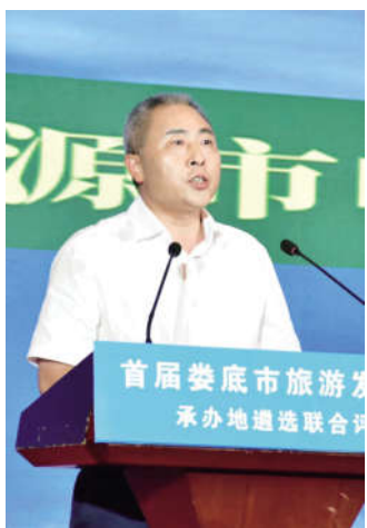
涟源市委书记刘杰作申办陈述