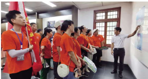
参观锡矿山展览馆

染废水变绿水,让塌陷贫地变耕地,昔日环境恶劣的锡矿山在绿色发展中新焕发发生机和活力。