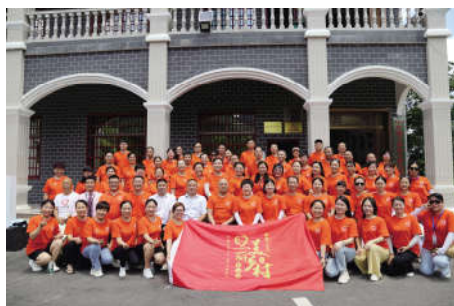
参观山斗冲地下党支部陈列馆并合影