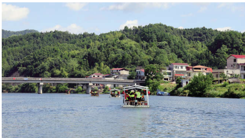
乘坐竹筏观赏双源村美景

下午,观摩团成员来到了三塘铺镇东方村,该村是闻名全国的耐磨材料生产基地,是双峰县铸造行业的发源地。全村面积2.4平方公里,共有同心工业园区1个,铸造企业20家,其中规模以上企业8家。2020年,东方村充分发挥统战优势,积极开展“迎老乡、回故乡、建家乡”行