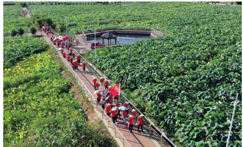
观摩芙蓉村荷花基地

近年来,双峰县把创建“同心美丽乡村”作为助力乡村振兴战略的有力抓手,组织、引导广大统一战线成员投身美丽乡村建设,全面推进乡村产业振兴、人才振兴、文化振兴、生态振兴、组织振兴,为促进巩固拓展脱贫攻坚成果同乡村振兴有效衔接、奋力建设现代化富厚双峰贡献统战力量。目前,全县已创建省级“同心美丽乡村”示范点2个,市级“同心美丽乡村”示范点4个,县级“同心美丽乡村”示范点22个。(王友专 钟志敏)