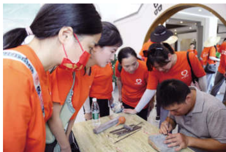
观摩溪砚非遗馆制砚技艺