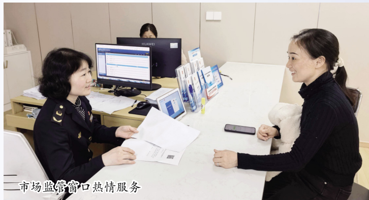
市场监管窗口热情服务

强制注销清淤出清，市场更有序。聚焦吊销未注销、长期停业的“僵尸企业”，严格依法启动强制注销程序。对吊销营业执照满三年未主动注销的企业，通过国家企业信用信息公