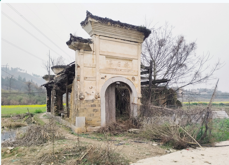
新化县孟公镇清水村老茶亭:漪石亭

在失去他们的日子里,我常常独自漫步在他们曾共同走过的路上,仿佛还能听见妻子的笑声,看见她温柔地搀扶着父亲的身影。那一刻,我深刻地体会到,爱,不仅仅是一种情感的流露,更是一种责任与坚持,即使面对困难与挑战,也绝不轻言放弃。