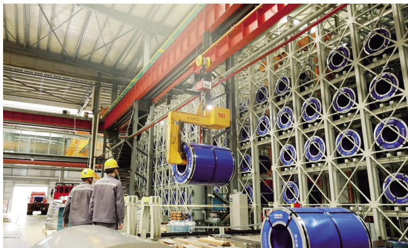
湖南宏旺新材料科技有限公司进行机械化作业堆放成品硅钢

创新赋能，集聚发展要素。该区开通重点产业项目审批“绿色通道”，2025年“材料谷”建设完成投资41.01亿元，湖南宏旺10万吨钛材项目从签约到开工仅用3个月。全年新增国家高新技术企业8家（总数达74家）、省级以上创新平台3个。湖南宏旺取向硅钢产量居全国民企第一，下线全省首块高磁取向硅钢；爱派尔下线全省首台五轴数控加工中心，建成数控装备产业园，85%关键